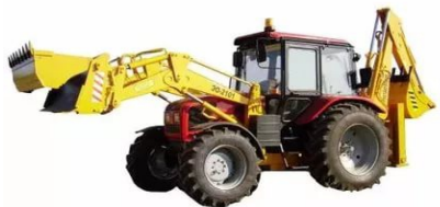
Экскаватор — погрузчик