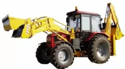
Экскаватор — погрузчик